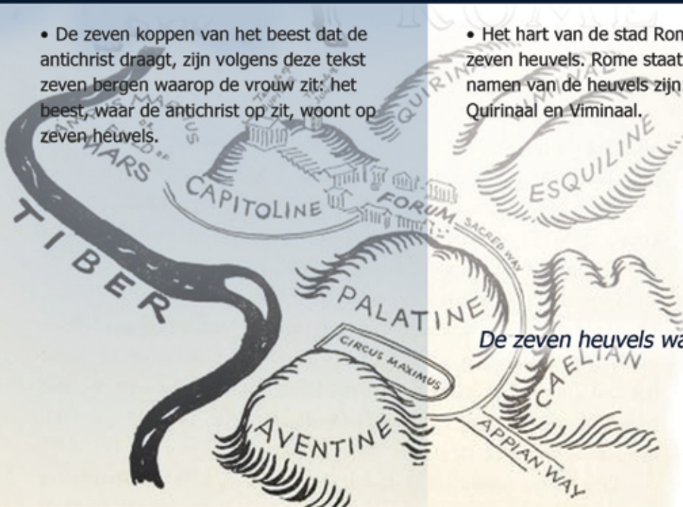
De zeven heuvels waar Rome op is gebouwd

• Het hart van de stad Rome (ten oosten van de rivier de Tiber) ligt op zeven heuvels. Rome staat zelfs bekend als 'de stad op zeven heuvels'. De namen van de heuvels zijn: Palatijn, Capitool, Aventijn, Coelius, Esquilijn, Quirinaal en Viminaal.